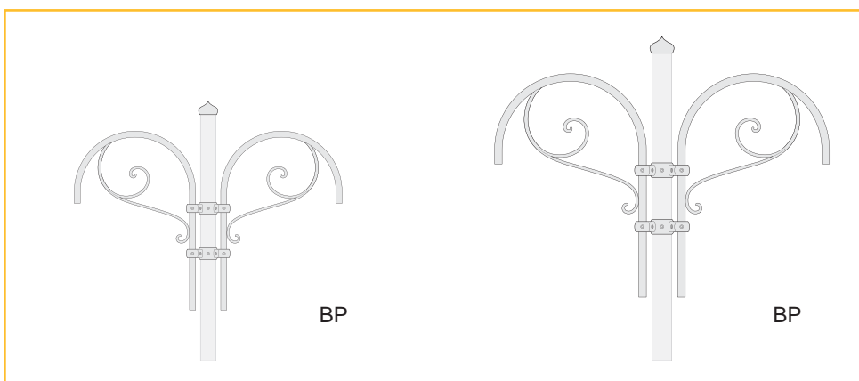
Cima BML - curva Ø700 h1000 BP/TP